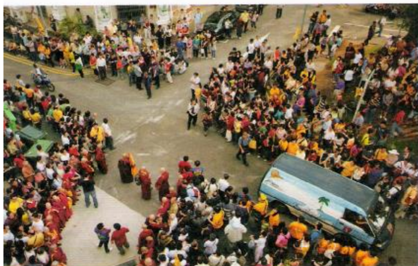
佛在人間，娑婆眾生契緣引頸等待！

我一上來一看，桌上擺了一張紙條，是蓮花福山（譯名）寫的，他是參「什麼是圓滿證悟？」他說把萬緣放下，心就跟虛空一樣，實在是沒有什麼分別，平等平等，一切都是平等的。這個個寫得很好，本來就是要把萬緣放下，心像虛空，沒有什麼分別、平等。這個萬緣放下，我要問的是「為什麼？」。寫得很好，也寫得很對，但「為什麼」能夠萬緣放下？要參這個。就是說，你能夠萬緣放下，在怎麼子的狀況之下，你能夠萬緣放下，這樣子才能夠圓滿證悟，要參就要參這個。你寫的都是對的，這個個很好、很對，平等、無分別、像虛空、放下，都是很好。為什麼能這樣？這個要參。 你度眾生沒有分別，那麼我們樓下的這個新加坡（雷藏寺）、（獅城雷藏寺），還有（圓證堂）附近的這些街，統統要度。你沒有分別嘛！沒有分別，所以統統要度！我們廣度眾生，就要不捨一個眾生，這是一個要點，很重要。 我今天要講的就是「時輪金剛禪定九次第法」，是很珍貴的。也可以這樣子講，你要相應的總樞紐，就在「禪定九次第法」；你要得到證悟，也在「禪定九次第法」：